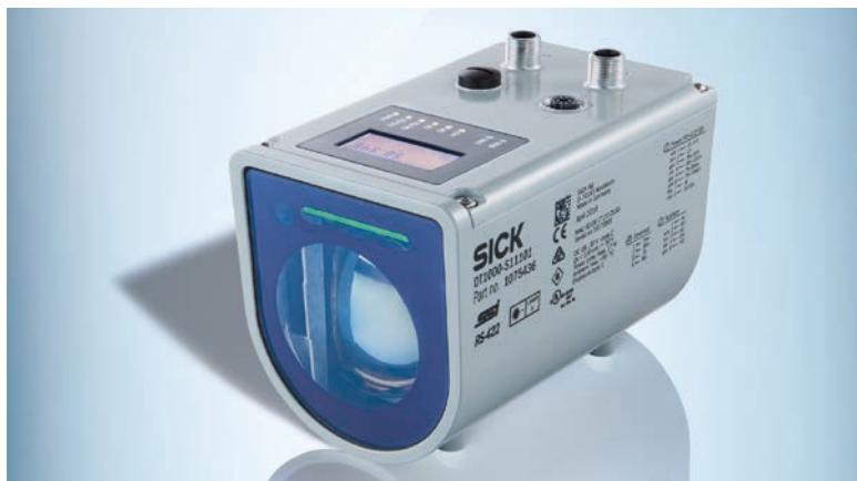
Der Long-Range-Distanzsensor DL1000 hat sich dabei bewährt, die Verformungen der Brückenpfeiler aus Stahlbeton beim Brückenbau zu vermessen.

Während eines Verschiebs, der mehrere Tage dauert, herrschen an der Hochmoselbrücke bei allen Beteiligten absolute Konzentration und Hochspannung. Denn das Verfahren läuft nicht automatisiert,