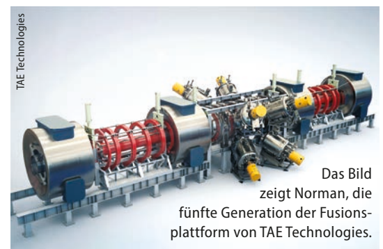
Das Bild zeigt Norman, die fünfte Generation der Fusionsplattform von TAE Technologies.

Neben den finanziellen Daten listet das Papier den erwarteten Markteintritt auf. Der internationale Forschungsreaktor ITER, der Ende der 2020er-Jahre in Südfrankreich in Betrieb gehen soll, 8) wird noch keinen Strom liefern. Die beteiligten Staaten erwarten dies erst von einem Nachfolgeprojekt. Auch das staatliche britische Projekt STEP, für das momentan noch fünf Standorte im Rennen sind, soll erst nach 2040 netto Elektrizität erzeugen. 9) Jedoch meinten zwei Drittel der befragten privaten Unternehmen, dass sie bereits im nächsten Jahrzehnt in kleinerem Maßstab ans