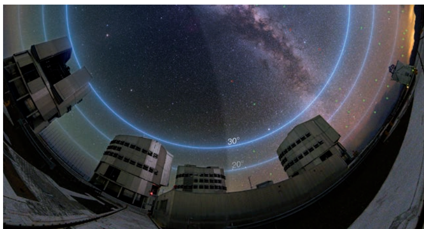
Die Bereiche des Himmels, in denen astronomische Beobachtungen am stärksten von Satellitenkonstellationen gestört werden, sind durch die blauen Linien begrenzt.

Das untersucht eine wissenschaftliche Studie, welche die ESO in Auftrag gegeben hat. Diese konzentriert sich auf Beobachtungen mit ESO-Teleskopen im sichtbaren und infraroten Bereich, zieht aber auch