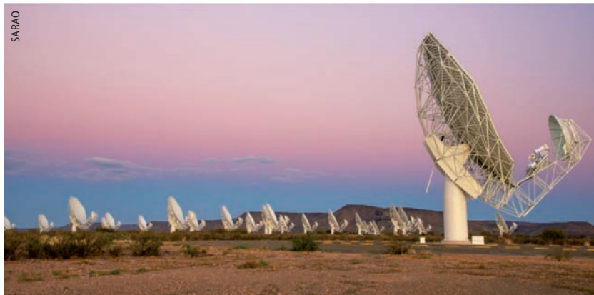
Das Radioteleskop-Array MeerKAT wird bis 2022 weiter ausgebaut.

An dem Projekt sind mehrere Länder beteiligt, darunter neben Südafrika und Australien auch Kanada, China und Großbritannien. Deutschland war aus Kostengründen 2015 aus dem Projekt ausgestiegen. Nach diversen Verhandlungen, bei denen es unter anderem darum ging, ob Deutschland als assoziiertes Mitglied wieder hinzukommt, ist im letzten Jahr die