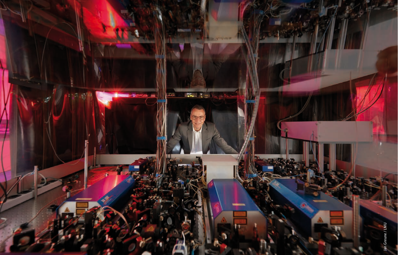
Jan Greune / LMU