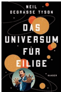
Neil deGrasse Tyson: Das Universum für Eilige Hanser Verlag, München 2018, geb., 192 S., 17,00 € ISBN 9783446258358

Plädoyer an die Vernunft zeigt sich deGrasse Tyson als Optimist, der im Verständnis der Rolle des Menschen im Universum den Schlüssel zu einem friedlichen und nachhaltigen Miteinander sieht.