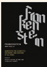
Mary Shelley: Frankenstein. Annotated for Scientists, Engineers, and Creators of All Kinds The MIT Press, 2017, geb., 320 S., 19,95 $ ISBN 9780262533287

Das Jubiläumsjahr ist eine gute Gelegenheit, die Urfassung von Mary Shelleys Klassiker neu zu entdecken. Wer die englische Originalfassung bevorzugt, dem bietet sich eine neue Ausgabe an, die Kommentare und Essays enthält, welche die wissenschaftlichen Aspekte des Romans und seine Tragweite für heute ausloten. Das PDF des Buches steht kostenlos zum Download bereit: https://bit.ly/2MqgHSu .