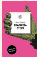
Mary Shelley: Frankenstein Manesse Verlag, München 2017, geb., 22 € ISBN 9783717523703

Das Jubiläumsjahr ist eine gute Gelegenheit, die Urfassung von Mary Shelleys Klassiker neu zu entdecken. Wer die englische Originalfassung bevorzugt, dem bietet sich eine neue Ausgabe an, die Kommentare und Essays enthält, welche die wissenschaftlichen Aspekte des Romans und seine Tragweite für heute ausloten. Das PDF des Buches steht kostenlos zum Download bereit: https://bit.ly/2MqgHSu .