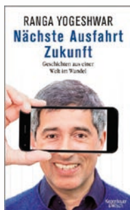
Ranga Yogeshwar: Nächste Ausfahrt Zukunft Kiepenheuer & Witsch, Köln 2017, geb., 398 S., 22 € ISBN 9783462051131

Wohin führen uns zukünftige technische Entwicklungen wie Big Data oder selbstfahrende Autos? Und was bedeuten sie für uns Menschen und unser Selbstverständnis? Der Untertitel des Buches „Geschichten aus einer Welt im Wandel“ beschreibt ziemlich gut, worum es geht. Der TV-Moderator und Phy-