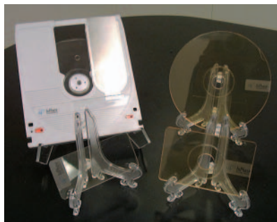
Das erste langzeitstabile Medium zur holographischen Datenspeicherung kann mehr Daten speichern und hat eine höhere Transferrate als die heute üblichen DVDs.

lographischen Datenträger und Laufwerke Ende 2003 ausliefern zu können. Derzeit testen bereits zahlreiche andere Unternehmen das neue Material.