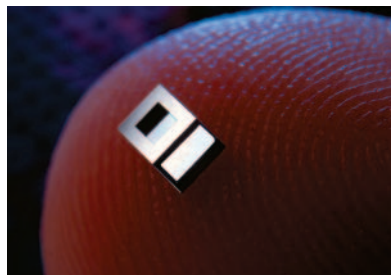
Forscher aus Dänemark bauen winzige Kondensatormikrofone aus Silizium und integrieren diese zusammen mit den zur Signalverarbeitung notwendigen Bauelementen auf einem Chip. Diese Mikrofon-Chips sind nur ein Zehntel so groß wie handelsübliche Kleinstmikrofone.

Schallsensoren aus Silizium sind nicht wirklich neu. Doch diese platzsparenden Mikrofone konnten bisher nicht direkt auf Chips implementiert werden. Entwickler des Unternehmens Sonion können nun mit Standardmethoden der Chip-Herstellung einen winzigen Hohlraum unter eine Silizium-Oberfläche ätzen, sodass eine rund 500 nm dünne Membran und eine perforierte Gegenelektrode stehen bleiben, die ein Kondensatormikrofon bilden. Diese hauchdünne Schichtmembran wird beim Auftref-