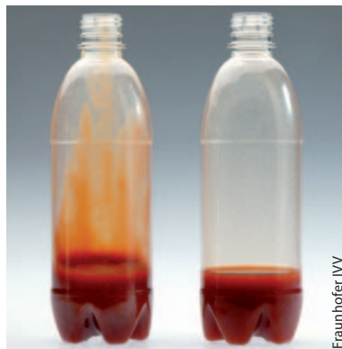
In beschichteten Flaschen (rechts) bleibt weniger Inhalt haften.

So viel man auch klopft und schüttelt, der Rest Ketchup will einfach nicht aus der Flasche fließen. Auch bei Körperpflegemitteln stecken teilweise noch bis zu 20 Prozent des Inhalts in der Verpackung, wenn diese in den Müll wandert. Beim Recycling kommen die verunreinigten Verpackungen jedoch teuer zu stehen, weil die ausgespülten Reste mancher Chemikalien oder Medikamente fachmännisch zu entsorgen sind.