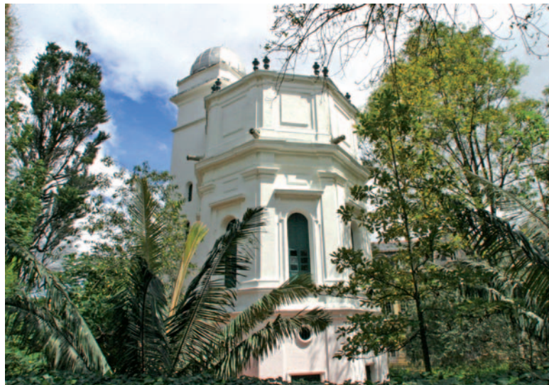
Abb. 1 Das alte astronomische Observatorium von Bogotá, 1803 unter der Leitung von José Celestino Mutis errichtet, war das erste seiner Art auf dem latein-

Kolumbien schickt sich an, den Schritt von einer in weiten Teilen noch ländlich geprägten Wirtschaft zur postindustriellen Wissensgesellschaft in einem großen Sprung zu vollziehen [1]. Dementsprechend ist die Spanne unterschiedlicher Entwicklungsstufen und unabhängiger Kulturen, die hier auf engstem Raum zusammentreffen, aus deutscher Sicht fast unvorstellbar weit: Sie reicht von nomadischen Jäger- und Sammlervölkern bis zur akademischen Mittelschicht der Metropolen, die sich in Frankfurt oder New York ebenso zuhause fühlt wie in Bogotá, sowie von den indigenen Ethnien der Anden und des Amazonastieflands über die kreolischen Familien europäischen Einschlags bis zu den Nachfahren der afrikanischen Sklaven, die im 16. und 17. Jahrhundert ins Land verschleppt wurden. So ergibt sich eine äußerst heterogene