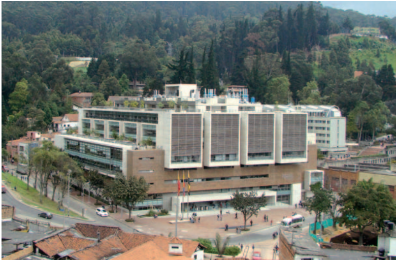
Abb. 4 Das neue Gebäude ( Edificio Mario Laserna ) der ingenieurwissenschaftlichen Fakultät der Universidad de los Andes in Bogotá ist der zukünftige Sitz des Forschungszentrums CeIBA. Die andalusisch anmutenden Ziegeldächer im Vordergrund gehören zum traditionsreichen Viertel Germania .

Ein weiteres schwerwiegendes Strukturproblem ist der Mangel an institutionell geschützten Freiräumen für die Forschung, die vor allem unter der sehr hohen Lehrverpflichtung und dem enormen Zeitaufwand für Verwaltungstätigkeiten leidet. Gewöhnlich sind zehn bis zwölf Wochenstunden zu unterrichten, Unterstützung durch Hilfskräfte oder Sekretärinnen gibt es kaum. Eine stimulierendere Arbeitsatmosphäre ist hier also dringend erforderlich. In dieser Hinsicht hat Colciencias die Initiative ergriffen und ein erstaunlich modern anmutendes Programm zum Aufbau von Forschungszentren aufgelegt, die sich mit Sonderforschungsbereichen oder eher noch mit Exzellenzclustern vergleichen lassen. Allerdings sind die Themen in groben Zügen vorgegeben; sie orientieren sich an strategischen Interessen des Landes, die vom Consejo de Ciencia y Tecnología , einer Art Wissenschaftsrat, definiert werden. Dazu zählen etwa Zentren für Biodiversität und genetische Ressourcen, für Anbau und Vermarktung tropischer Heilpflanzen sowie für umfassende Entwicklung und die Stärkung öffentlicher Institutionen in Regionen, die von bewaffneten Konflikten betroffenen sind.