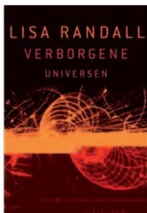
L. Randall: Verborgene Universen S. Fischer Verlag, 2006, 544 S., geb. 19,90 € ISBN 9783100628053

Anfangs erklärt die Autorin sehr ausführlich das Konzept zusätzlicher Raum-Zeit-Dimensionen,