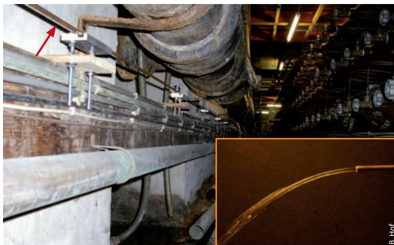
Abb. 1 Wissenschaft in der Unterwelt: Unterhalb eines Abwasserrohrs ist ein 4 mm dünnes und 30 m langes Rohr montiert (Pfeil), mit dem sich der Übergang zwischen turbulenten und laminaren Strömungen untersuchen lässt. Am Beginn des Rohr eingebrachte Störungen äußern sich als „Zuckung“ im Austrittsstrahl (Inset), falls sie nicht innerhalb der 30 m zerfallen sind.

Die Empfindlichkeit der Rohrströmung gegen kleine Störungen ist bemerkenswert, da das laminare Geschwindigkeitsprofil (Hagen-Poiseuille-Profil) linear stabil ist. Verantwortlich für diese Empfindlichkeit ist das Wechselspiel zwischen Nichtlinearität und Nichtnormalität [2–6] der Navier-Stokes-Gleichung – der Grundgleichung der Hydrodynamik. Selbst niedrigdimensionale Modellsysteme zeigen ein solches Übergangsszenario zur Turbulenz [7]: