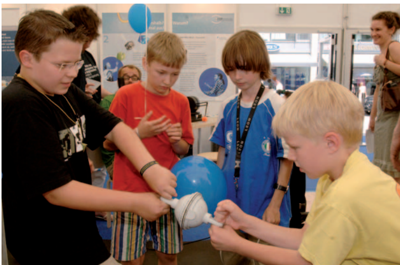
Der parallel zur ESOF-Tagung stattfindende Wissenschaftssommer bot zahlreiche Aktivitäten für neugierige Jungforscher.