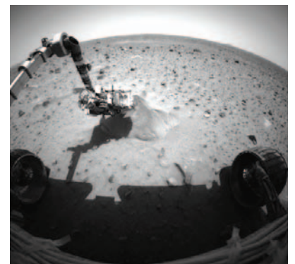
Das in Mainz entwickelte APX-Spektrometer befindet sich am Arm der Marsrover Spirit und Opportunity.

Jahrzehnte aufgebaute wissenschaftliche Exzellenz und internationale Spitzenstellung könne in kürzester Zeit zerstört werden. „Wenn die Entwicklung so weitergeht, können wir in fünf Jahren einpacken“, bringt es Hasinger, Direktor am Max-Planck-Institut für Extraterrestrische Physik in Garching, auf den Punkt. Die Ausgaben für das nationale Weltraumprogramm stiegen bis 1990 kontinuierlich an und lagen etwa gleichauf mit den Ausgaben für das Wissenschaftsprogramm der ESA. Seither sind die ESA-Ausgaben aufgrund langfristiger internationaler Verträge deutlich gewachsen, die nationalen Ausgaben aber kontinuierlich um zwei Drittel zurückgegangen. Während die nationalen Ausgaben 2001 nur noch die Hälfte der ESA-Ausgaben betragen, lag dieses Verhältnis in Frankreich bei fast einem Faktor 2, in Italien bei fast 1,5. Daher sei Deutschland nicht mehr in der Lage, sich dem deutschen ESA-Anteil entsprechend an national finanzierten Instrumenten sowie deren wissenschaftlicher Auswertung zu beteiligen. So beklagen z. B. Klimaforscher, dass keine ausreichenden Mittel zur Verfügung stehen, um die Daten des Erdbeo-