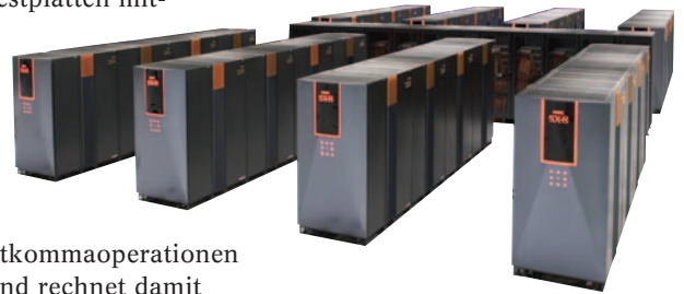
Der neue NEC-Supercomputer des Höchstleistungsrechenzentrums Stuttgart.

Bau und Ausstattung des HLRS kosteten insgesamt 57 Millionen Euro, von denen das BMBF 23,5 Millionen Euro als Teil der Gemeinschaftsausgabe Hochschulbau übernahm. Der Anteil des Landes