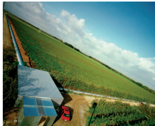
an der Uni Hannover, das den Gravitationswellen-Detektor GEO 600 betreibt, besitzt das AEI seit 2002 auch ein experimentelles Standbein. (Fotos: AEI)

Das AEI feiert seinen zehnten Geburtstag insbesondere mit der Konferenz „Geometry & Physics after 100 Years of Einstein's Relativity“ vom 5. bis 8. April. Daneben beteiligt es sich im Einstein-Jahr aktiv an zahlreichen Aktionen für die Öffentlichkeit. (AP)