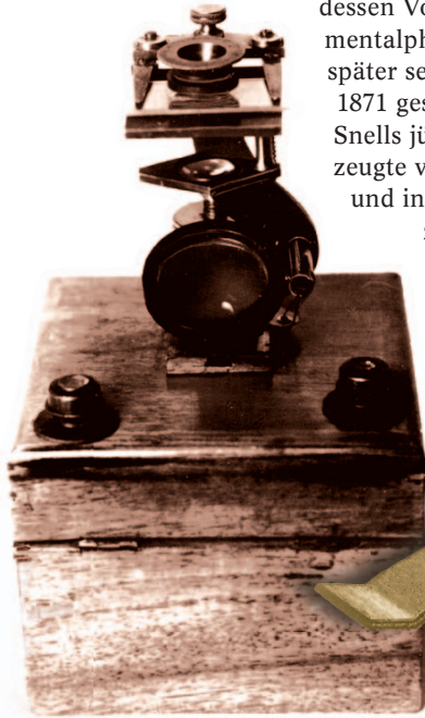
Einfaches Mikroskop der Optischen Werkstätte Carl Zeiss um 1847 (links) sowie Präparier-Mikroskop von Zeiss aus dem Jahr 1870

assistierte Abbe zudem Snell in dessen Vorlesung zur Experimentalphysik, die er ein Jahr später selbst abhielt. Abbes 1871 geschlossene Ehe mit Snells jüngster Tochter Else zeugte von einem engen und innigen Verhältnis zur Familie seines