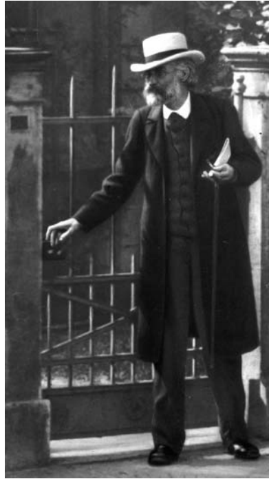
Ernst Abbe am Gartentor seines Hauses, nach 1900

Schottwerken dem Sachsen-Weimarischen Staat und der Jenaer Universität überschreiben, denn seiner Meinung nach waren die Betriebe zu einer Art „öffentlichem Gut“ geworden und ihre „Erhaltung, Fortbildung und dauernde Sicherung“ eine „Sache von öffentlichem Interesse“. Abbe stiftete deshalb 1886 schon einen „Ministerialfonds für wissenschaftliche Zwecke“, welcher