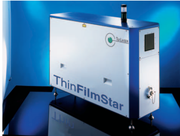
Abb. 1: Excimerlaser eignen sich für ein breites Anwendungsspektrum. Hier gezeigt ist der speziell für die Pulsed Laser Deposition (PLD) entwickelte „ThinFilmStar“. Durch die hohe Puls wiederhol frequenz eignet sich dieser Laser besonders für ein schnelles epitaktisches Abscheiden von Filmen mit einer Atomlage.

Die extrem kurze Wellenlänge hat für die industrielle Anwendung zwei entscheidende Vorteile. Zum einen lässt sich mit entsprechenden Optiken natürlich eine hohe Auflösung und damit eine geringe Strukturgröße erreichen. Zum anderen sind die Absorptionslängen fast aller Materialien im UV-Bereich so kurz, dass auftreffende Laserenergie größtenteils oberflächennah absorbiert wird. Somit wird auch bei Fluenzen von