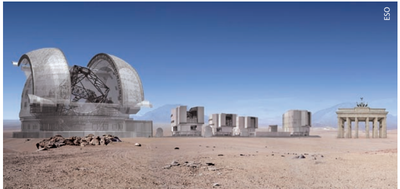
Das E-ELT mit seiner fast 90 Meter hohen Kuppel im Vergleich mit dem VLT und dem Brandenburger Tor. Wegen der

Mit einem Hauptspiegeldurchmesser von 42 Metern wird das E-ELT das größte optische Teleskop der Welt sein. Ursprünglich planten die europäischen Astronomen einen 100-Meter-Titanen, 2) wegen der technischen Herausforderungen stellten sie dieses Vorhaben aber zurück. Unter amerikanischer Führung entstehen zeitgleich zwei Instrumente der 30-Meter-Klasse, das Giant Magellan Telescope und das Thirty Meter Telescope. Die Europäer wollten jedoch nicht unter 42 Meter gehen, denn dies ist die Grenze, um Doppler-Verschie-