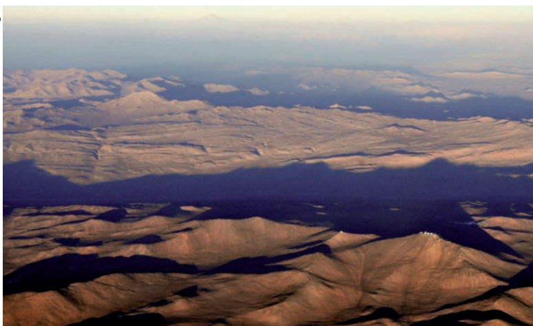
Blick vom Westen auf den Cerro Paranal mit den vier großen Kuppeln des VLT (vorn rechts). Links von der Bildmitte er-

hebt sich ein einzelner Gipfel: der 3060 Meter hohe Cerro Armazones – rund 20 Kilometer vom Paranal entfernt.