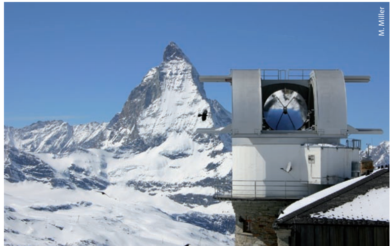
Seit nunmehr 25 Jahren steht das KOSMA-Teleskop in spektakulärer Lage

Derzeit laufen auf dem etwa 4000 Meter hohen Plateau im Himalaya die Vorbereitungen für KOSMA. Der Betonsockel ist bereits gegossen, das Gehäuse und die Kuppel für das Teleskop sind in Bau. „Im Frühjahr kommen die