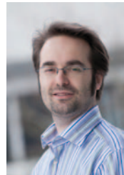
Martin B. Plenio

■ Die DPG verleiht gemeinsam mit dem britischen Institute of Physics (IOP) jährlich den Max-Born-Preis in Erinnerung an das Wirken des Physikers Max Born (1882–1970) in Deutschland und Großbritannien. Der erstmals 1973 verliehene Preis wird abwechselnd einem britischen und einem deutschen Physiker zuerkannt. Er besteht aus einer Urkunde, einer silbernen Gedenkmedaille und einem Geldbetrag.