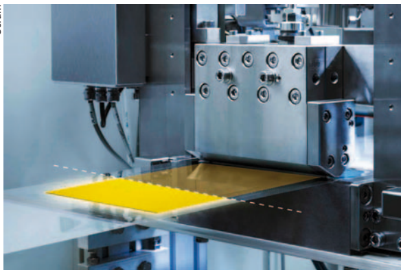
Ein- und ausgeschaltete LECs auf der Versuchsanlage bei Osram – gedruckt auf einer Endlosfolie

Was bei Radar, Richtfunk, Rundfunk und Radioastronomie klappt, ist prinzipiell auf den optischen Bereich übertragbar. Da die charakteristischen Wellenlängen dort je-