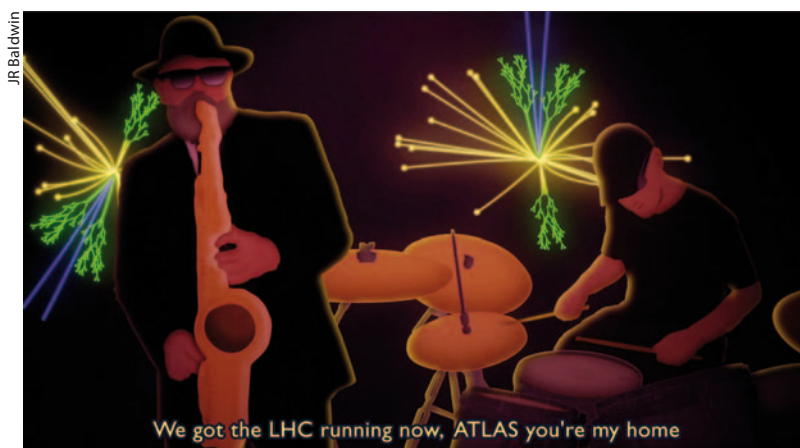
Die Canettes Blues Band rekrutiert sich aus CERN-Forschern und hat zu ihrem

Die Verbindung zwischen Musik und Physik geht jedoch tiefer als launige Musikvideos. Die Daten der Teilchendetektoren lassen sich nämlich auch hörbar machen. Das beweist eine Gruppe von Teilchenphysikern, Komponisten, Programmierern und Künstlern, die sich 2010 zum Projekt „LHCSounds“ zusammengefunden haben, um die Ergebnisse der Öffentlichkeit auf neuartige Weise zu präsentieren. 3) Ausgangspunkt sind echte oder simulierte Daten vom ATLAS-Detektor, die sie in ein Format umwandeln, das sich von Kompositionssoftware verarbeiten lässt. Das Ergebnis sind ulkige Klangfolgen, bei denen man sich an frühe Versuche mit Synthesizern erinnert fühlt. Doch diese „Sonifikation“ ist nicht nur Spielerei. Die NASA etwa hat begonnen, Daten von der Sonne oder Planeten in Klänge umzuwandeln. Die Wissenschaftler erhoffen