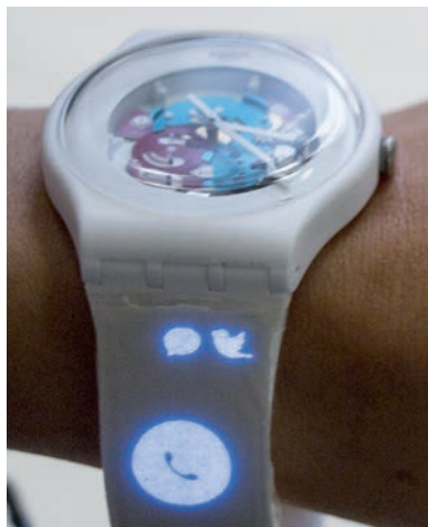
Das Display leuchtet auf, wenn eine Nachricht auf dem Smartphone – oder auf einer Smartwatch – eingegangen ist.

Die Leuchtdichte der Displays hängt vom Trägermaterial, der Spannung und dem AC/DC-Wandler ab, über den die Ansteuerung erfolgt. Sie liegt bei den Mustern zwischen 120 und 280 cd/m 2 . Biege- und Falltests zeigten, dass die Displays mehrere tausend Verformungen überstehen, ohne dass ihre Leuchtdichte darunter leidet.