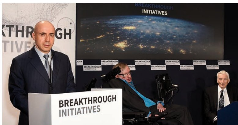
Der russische Milliardär Yuri Milner (links), der das SETI-Projekt großzügig

Die Versorgung mit dem Edelgas Helium, das für die Tieftemperaturphysik und viele Bereiche der Technik wichtig ist, bleibt problematisch. 3) Vor zwei Jahren wurde der Verkauf des begehrten Gases aus dem staatlichen Vorrat, der 40 Prozent der US-Reserven aus-