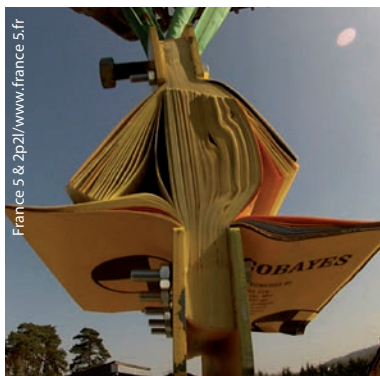
Abb. 2 In der französischen Fernsehserie „On n'est pas que des cobayes!“ hängt ein Auto an der vermeintlich losen Verbindung zweier Telefonbücher.

Die enormen Kräfte entstehen durch die Geometrie des Versuchs und lassen sich durch das Amontonsche Gesetz erklären. Zwei Bücher, deren Seiten ineinander verzahnt sind, sind dicker als ihr jeweiliger Einband (Abb. 1). Zieht man nun an den Buchrücken, werden die einzelnen Seiten nicht parallel zu dieser Kraft, sondern unter einem Winkel \alpha aus dem Verbund gezogen. Damit spaltet sich die aufgebrachte Kraft – ähnlich der schiefen Ebene oder der Schraubverbindung – geometrisch zu einer Tangentialkraft und einer Normalkraft auf (Abb. 1). Die Geometrie des Buchs macht also einen