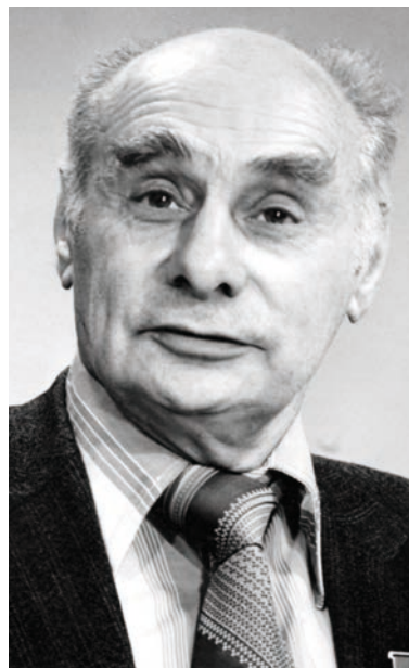
Abb. 2 Georgi Flerov

Auf Pontecorvos Tradition aufbauend engagiert sich das JINR gegenwärtig in mehreren Projekten zur Bestimmung der Neutrino-Eigenschaften bzw. in der Neutrinoastronomie. An einem Kernreaktor in der Stadt Twer unweit von Dubna finden zwei Experimente zur Bestimmung des magnetischen Moments des Neutrininos bzw. zur Suche nach „sterilen“ Neutrinos statt. Dubna ist auch an einigen Neutrino-Experimenten in Westeuropa und China beteiligt, z. B. am GERDA-Experiment. Am massivsten ist seit kurzem jedoch das Engagement für den „Gigaton Volume Detector“: Das große Neutrino teleskop im Baikalsee