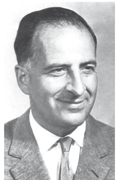
Abb. 3 Bruno Pontecorvo