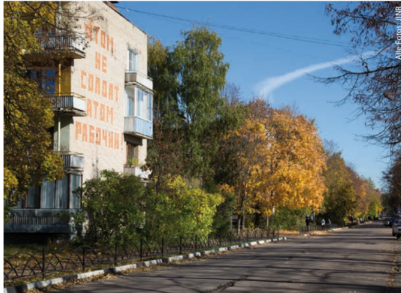
Rote Ziegel verkünden unübersehbar an der Stirnwand eines Wohnhauses in Dubna: „Das Atom ist kein Soldat, das Atom ist ein Arbeiter!“

Das Vereinigte Institut für Kernforschung (engl. Joint Institute for Nuclear Research, JINR) befindet sich in Dubna, etwa 120 km nordöstlich von Moskau. Von Beginn an war es auf die friedliche Anwendung der Kernenergie sowie auf Grundlagenforschung in der Kern- und Elementarteilchenphysik ausgerichtet. Bis kurz zuvor hatte Dubna allerdings noch zu jenen auf keiner Landkarte verzeichneten Ortschaften gehört, in denen während der 1940er-Jahre im Rahmen des sowjetischen Atombombenprogramms streng geheime Forschungsinstitute angesiedelt waren. Bei der Gründung des JINR konnte die Sowjetunion darum zwei existierende (zuvor ebenfalls geheime) Institute der sowjetischen Akademie der Wissenschaften in das internationale Institut einbringen – das Laboratorium für Kernprobleme mit seinem 680-MeV-Zyklotron und das Laboratorium für hohe Energien, in dem 1957 ein 10-GeV-Synchrotron seinen Betrieb aufnehmen sollte. In den Dubnaer Teilinstituten („Laboratorien“, Abb. 1) sind über sechs Jahrzehnte hinweg viele wichtige Resultate erzielt und neuartige Methoden entwickelt worden, die wir hier natürlich nur anhand von wenigen Beispielen beleuchten können.