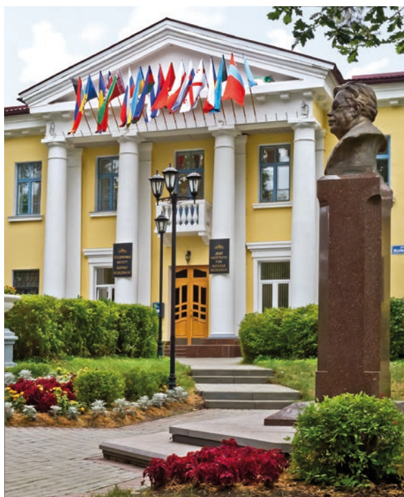
Abb. 5 Die Fahnen der Mitgliedsstaaten wehen über dem Eingang zum JINR-Verwaltungsgebäude. Besucher begrüßt eine Büste von Nikolaj Bogoljubov.

Die Gründung der Russischen Föderation führte zu einem neuen Ausrichten der Ziele und Arbeitsweise des JINR. So wurde 1990 beschlossen, dass das JINR seinen Charakter als internationales Zentrum verstärken soll. Neben die Grundlagenforschung sollte der Transfer der wissenschaftlichen Ergebnisse in die Industrie, Medizin und technische Gebiete treten. Die Leitungsfunktionen wurden nicht mehr nach Länderproporz, sondern nach fachlicher Qualifikation besetzt. Die Mitarbeiterzahl reduzierte sich von ehemals etwa 7000 auf 4500, wovon 1200 Wissenschaftliche Mitarbeiter und etwa