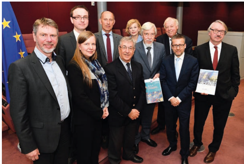
Die High Level Group übergibt zusammen mit Vertretern von SAPEA ihr drittes Meinungspapier „Food from the Oceans“ an die Europäische Kommission.

Die eine ist die High Level Group mit derzeit sechs anerkannten Wissenschaftlerinnen und Wissenschaftlern. Die andere ist SAPEA